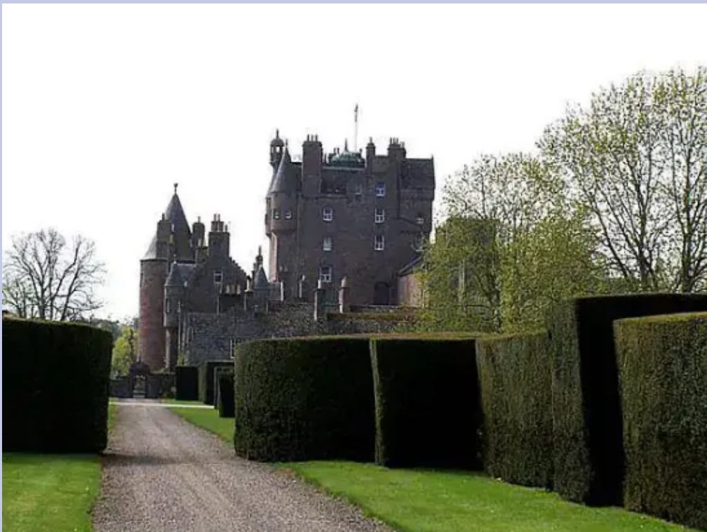
640px Glamis Castle Scotland

Anche noi ci vantiamo delle nostre rocche, castelli, case torri, motte e fossati: la diversa costituzione dei territori scozzesi permetteva che almeno un lato si potesse proteggere grazie ai laghi.