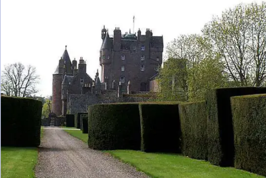
640px Glamis Castle Scotland

La storia scozzese si radica nelle profondità, attraverso popoli che si sono insediati in queste terre inospitali e ne hanno fatto la loro dimora.